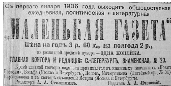
Подписная реклама, печатавшаяся в газете «Новое время» [9]