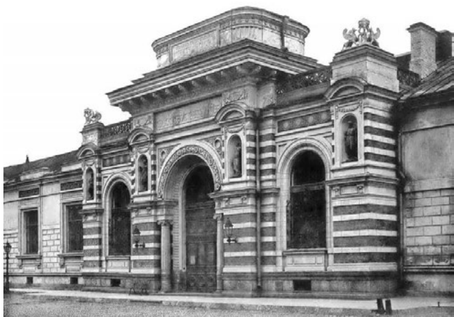
Императорский Сельскохозяйственный Музей Главного управления землеустройства и земледелия. Соляной городок. Фонтанка, 10. Фото конца 19-го века

«Работа началась при весьма скромной обстановке, так как в первое время научный персонал состоял только из двух лиц: заведующего Бюро и его помощника. За неимением собственного помещения пришлось воспользоваться гостеприимством Сельскохозяйственного Музея, отпустившего в распоряжение Бюро одну, впрочем, большую комнату. Зато основное оборудование сразу оказалось поставленным на должную высоту, так как значительный микологический гербарий, обширная библиотека, приборы и микроскопы были представлены Бюро его заведующим» [4].