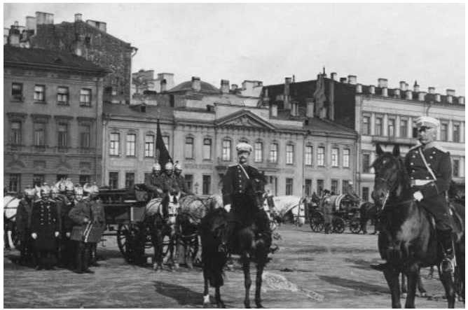
В двухэтажном этом здании до 1905 года находилась квартира Ячевских

Для него, как видно, гораздо поэтичнее звучало «Царицын луг», нежели просто «Царицынская улица». Когда вышла из печати адресно-справочная книга «Весь Петербург на 1904 год», то, согласно представленным ею сведениям, оказалось,