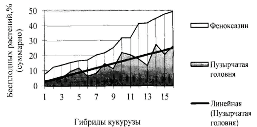
Рис. 2. Развитие бесплодия у гибридов кукурузы от "саблевидности" и пузырчатой головни после обработки гербицидом феноксазин (9 кг/га)

возникновении болезни, чем ингибирование или стимуляция уже внедрившегося гриба. Одним из таких условий является, по нашим данным, нарушение регламента применения гербицидов, приводящее к патологиям развития растений. Показателем в этой связи опыт селекционеров НПО «Элита», где запоздалая обработка в Черкасской области сортоиспытания гибридов гербицидом феноксазин (9 кг/га) привела к массовому развитию "саблевидности", при которой повреждение растений кукурузным мотыльком обусловило резкое увеличение поражения пузырчатой головней и бесплодие растений, достигшее суммарно 50%, в т.ч. 26.5% от пузырчатой головни (рис. 2). Высокая и достоверная коррелятивная зависимость этих показателей ( r=0.878 , p \leq .001 ) позволяет судить о вторичности патологического бесплодия, обусловленного патологией физиологической природы и инфицированием U. maydis , что привело к большей (в 19-23 раза) пораженности гибридов, чем в отсутствие гербицида. Районированные гибриды П 3969, Нордика, Коллективный 244 МВ (будучи устойчивыми к кукурузному мотыльку) проявили наибольшую устойчивость к бесплодию и головне соответственно.